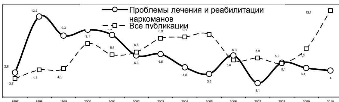
Рис. 3. Динамика освещения в СМИ проблем лечения и реабилитации наркозависимых, %

СМИ отмечают, что существует большое количество методик лечения наркотической зависимости и реабилитационных