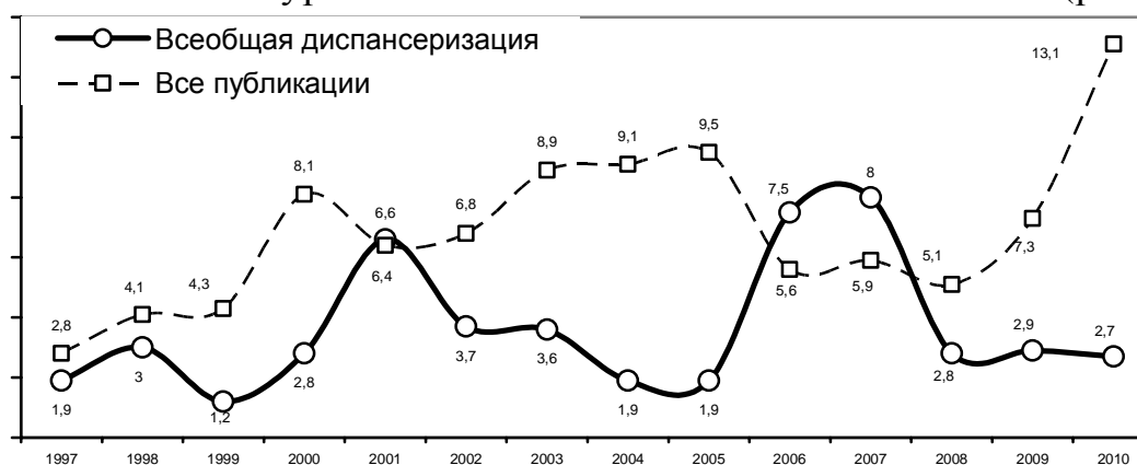
Рис. 4. Динамика освещения в СМИ проблемы всеобщей диспансеризации, %

Актуальность проблемы наркотизации российского общества как проблемы национальной подчеркивается активным обсуждением в обществе и трансляцией через СМИ сюжетов, связанных с возможностью и эффективностью превентивной борьбы с наркоманией и сопутствующими ей заболеваниями через всеобщую диспансеризацию. Сюжеты на эту тему существуют в публикациях всего анализируемого периода, но можно отметить два всплеска активности журналистов – в 2001 г. и в 2006–2007 гг. (рис. 4).